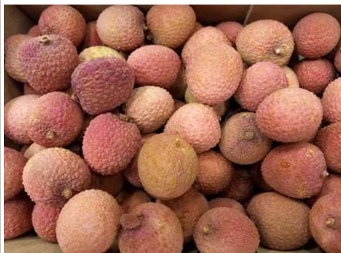
Litchis d'Afrique du Sud

Les fruits mis en vente présentent une qualité correcte, mais de nombreux lots se composent de fruits vieillissants et moins attractifs pour les consommateurs.