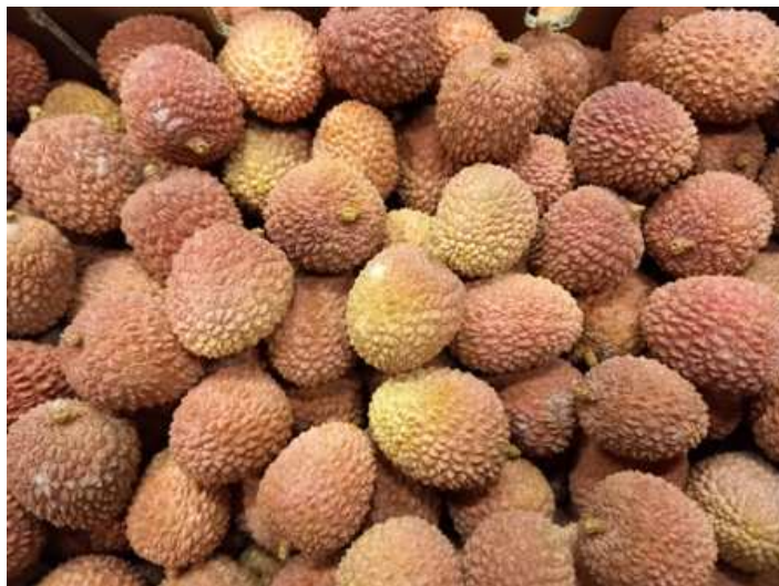
Litchis de Madagascar

Pays-Bas: Prix stables pour les fruits d'Afrique du Sud.