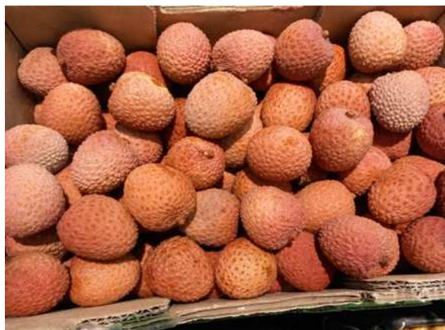
Litchis d'Afrique du Sud

Pays-Bas: Net replis du cours des litchis « bateau » de Madagascar et d'Afrique Australe en ce début d'année. On note également l'alignement des cours entre les fruits des différentes origines, illustrant la tension du marché pour le produit.