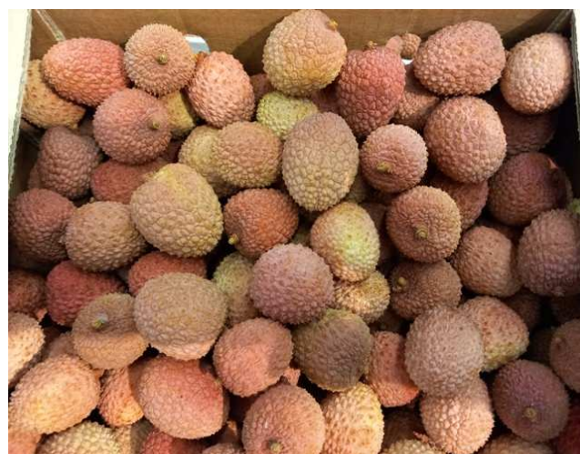
Litchis de Madagascar