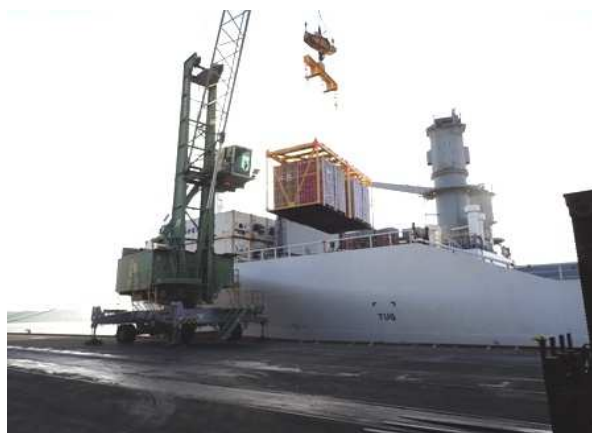
Opérations de déchargement à Zeebrugge

La commercialisation des litchis de Madagascar se poursuit dans de bonnes conditions de marché. Les prix sont revus en légère baisse, mais restent soutenus. Le second navire conventionnel est arrivé à Zeebrugge le samedi 17 décembre. Son déchargement s'est déroulé dès son arrivée. Les opérations de déchargement se sont interrompues le dimanche 18 et ont repris le lundi 19. Dès le lundi matin, plusieurs dizaines de camions pouvaient être chargés pour réapprovisionner les chaînes de distribution à l'échelle européenne. Le déchargement du bateau s'achevait le mardi 20 décembre en milieu de journée. Ces marchandises alimenteront les circuits de distribution pour la période entre Noël et le Nouvel An et au début de l'année 2023.