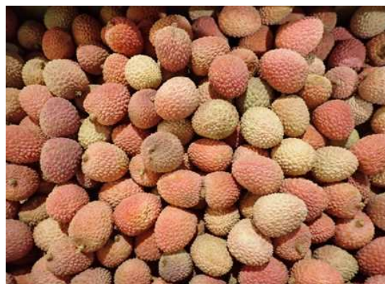
Litchis bateau de Madagascar

Pays-Bas: Fléchissement du cours des litchis de Madagascar et d'Afrique du Sud devant le développement de l'offre, alors que la demande reste moyenne pour le produit.