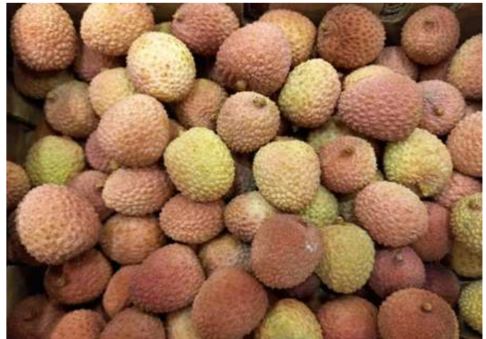
Litchis bateau de Madagascar

Pays-Bas: Tendence à la baisse pour les litchis « avion » d'Afrique du Sud, qui conservent néanmoins de prix de vente soutenus. La réception des litchis par voie maritime, moins onéreuse, en est l'une des raisons. Bonne mise en marché des litchi « bateau » d'Afrique du Sud et de Madagascar.