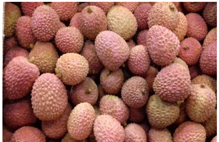
Litchis « bateau » de Madagascar

Pays-Bas: Baisse sensible du cours des litchis « avion ». Prix soutenus pour les fruits de Madagascar.