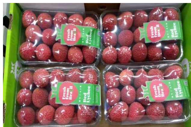
Litchis du Brésil

La campagne de commercialisation des litchis de Madagascar s'étire et les stocks du second navire conventionnel s'écoulent lentement. L'arrivée des litchis acheminés par conteneurs maritimes clôturer les réceptions de litchis malgaches. Ils approvisionnent la dernière phase de la campagne de cette origine et alimenteront les promotions en magasin à l'occasion du Nouvel An Chinois dans certains centres de consommation européens. Leur plus grande fraîcheur permet une revalorisation des prix de vente ponctuelle, mais elle risque de s'atténuer au fur et à mesure de l'écoulement des marchandises et de la concurrence des fruits Sud africains, mieux calibrés mais de qualité variable. L'Afrique du Sud et le Mozambique poursuivent leurs expéditions, avec des quantités régulières mais plus limitées que prévues. La baisse globale des quantités mises en marché favorise la vente des fruits de ces origines, dont les prix se raffermissent légèrement.