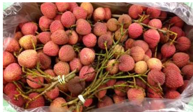
Litchis du Brésil en bouquet