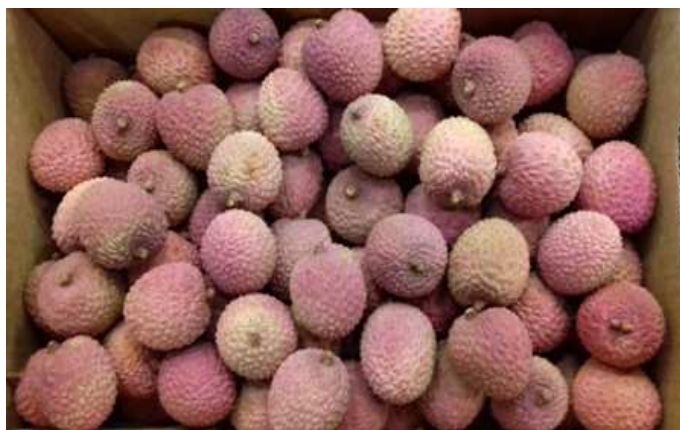
Litchis du Mozambique

Pays-Bas: Marché stable pour les litchis, avec une décote pour les fruits malgaches dont la qualité se dégrade comparativement aux lots d'Afrique du Sud d'arrivée plus récent.