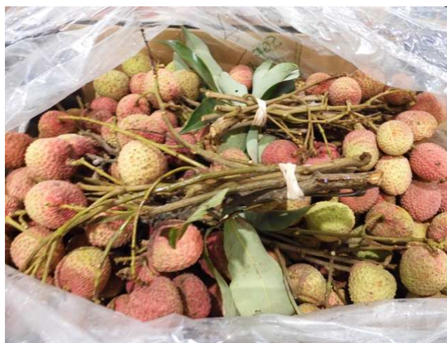
Litchis bouquet d'Afrique du Sud

Les prix de vente s'orientent à la hausse !