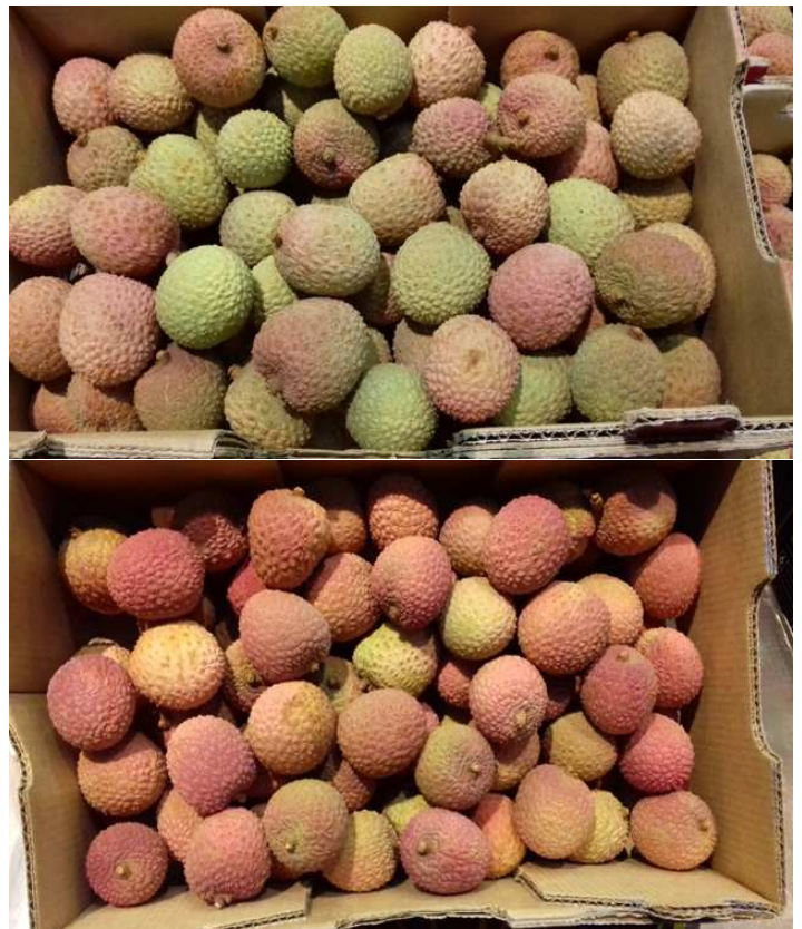
Litchis « bateau » d'Afrique du Sud

Pays-Bas: Marché essentiellement approvisionné en litchis d'Afrique du Sud en quantités limitées et vendus à prix fermes.