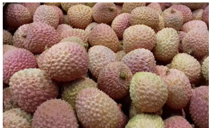
Litchis de Madagascar bateau

Pays-Bas: Première mise en marché des litchis de Madagascar.