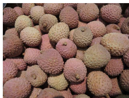
Litchis de Madagascar

Quelques conteneurs du Mozambique étaient également attendus à la fin de cette semaine.