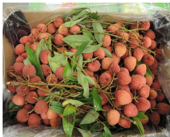
Litchis branchés d'Afrique du Sud, variété red Mac Lean

Pays-Bas: Ventes limitées mais assez stables pour les litchis d'Afrique du Sud.