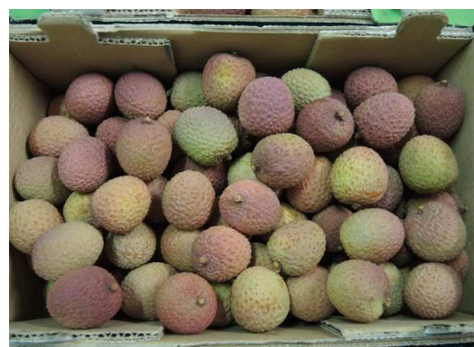
Litchis d'Afrique du Sud