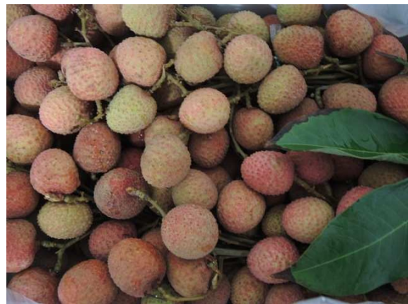
Litchis branchés de l'Ile Maurice

Livraisons encore marginales de la Réunion dont les prix de vente restent particulièrement élevés. La rareté des fruits de cette origine explique les tarifs pratiqués mais limite aussi l'écoulement des marchandises (fruits égrenés: 17.00€/kg, fruits présentés en bouquet: 20.00-25.00€/kg).