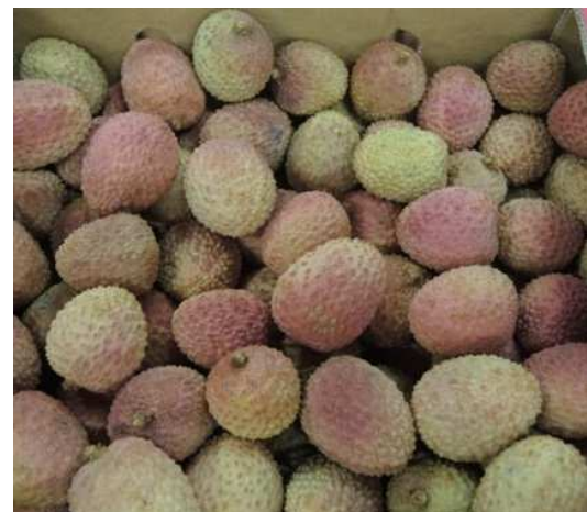
1er litchis de Madagascar

Les exportations de l'Ile Maurice restent marginales. Elles se composent de fruits présentés en bouquet et vendues à prix élevés et fermes.