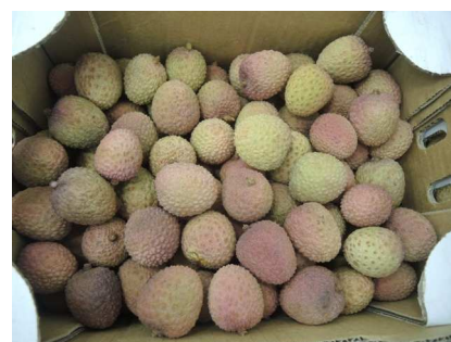
Litchis du Mozambique

Pays-Bas : Nette chute des prix des litchis mis en marché sur le marché hollandais parallèlement à l'augmentation des livraisons.